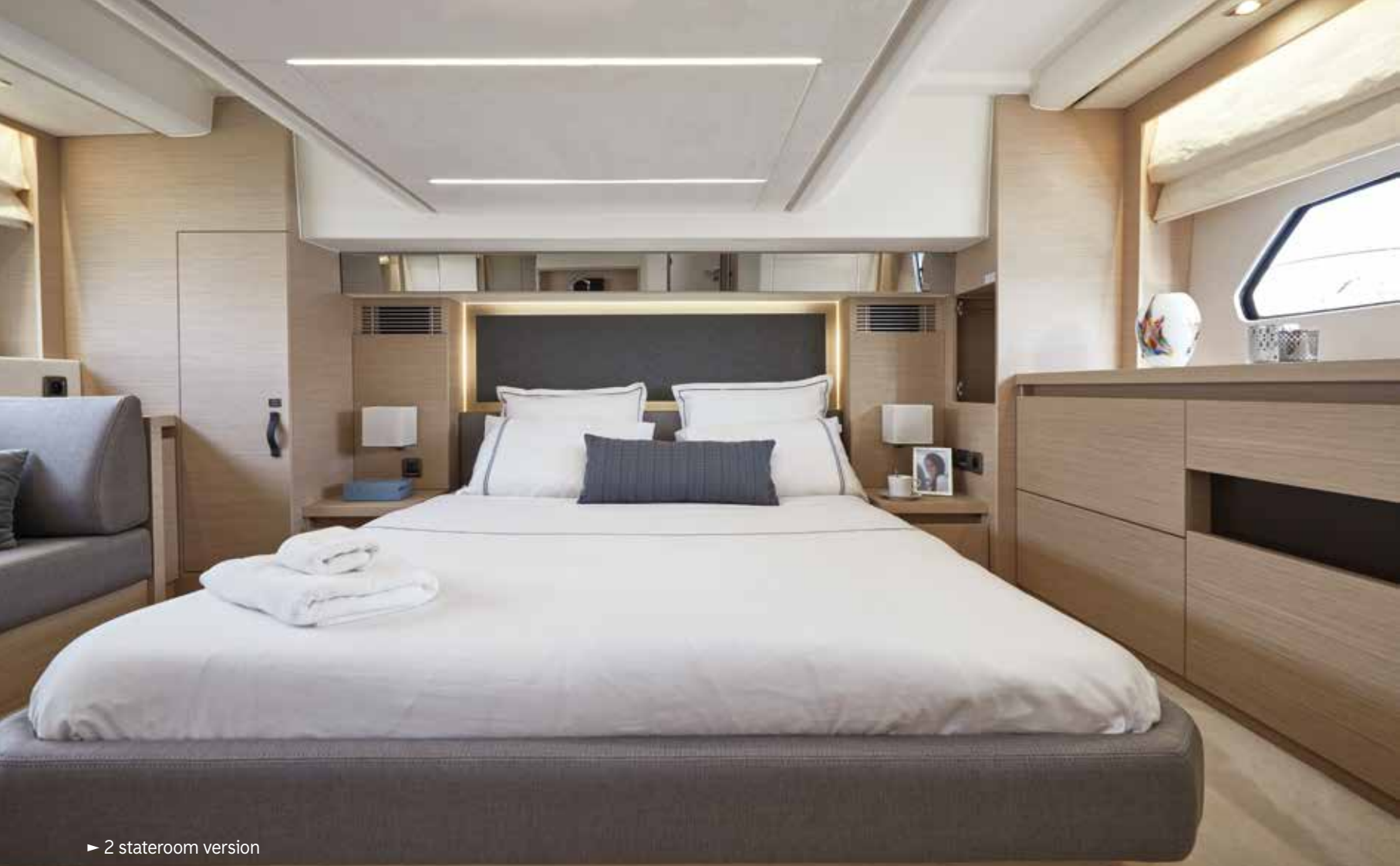
► 2 stateroom version