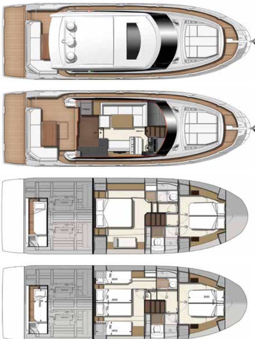
Model available with 2 or 3 staterooms

Connected boat technology. Equipped with seawapps CONNECT YOUR BOAT FREE YOUR MIND